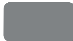
N-55 (標準色) HCエコトップゼロクールのみ